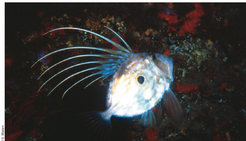
Le saint-pierre, toutes nageoires déployées.

offrir l'opportunité de rencontres plus assurées qu'ailleurs. Il est observé le plus souvent sur des sites qui possèdent à leur proximité des fonds assez importants, mais pas exclusivement. Sur la côte Atlantique on cite Saint-Cast, Saint-Brieuc, Carantec, Trébeurden, Les Glénan... En Méditerranée: Cerbère, la côte Bleue, les îles d'Hyères... Toutefois, en aucun de ces sites, on ne devrait vous garantir une probabilité absolue de rencontre. Mais allez-y voir quand même... Vous y êtes arrivé, les dieux de la mer sont avec vous, et enfin vous le voyez! C'est lui, pas de doute. Reconnaissons qu'il faudrait être bien peu physionomiste pour le confondre avec un autre. Alors maintenant, si vous voulez prolonger le plaisir de cet instant, il s'agit de garder la tête froide. Pré-