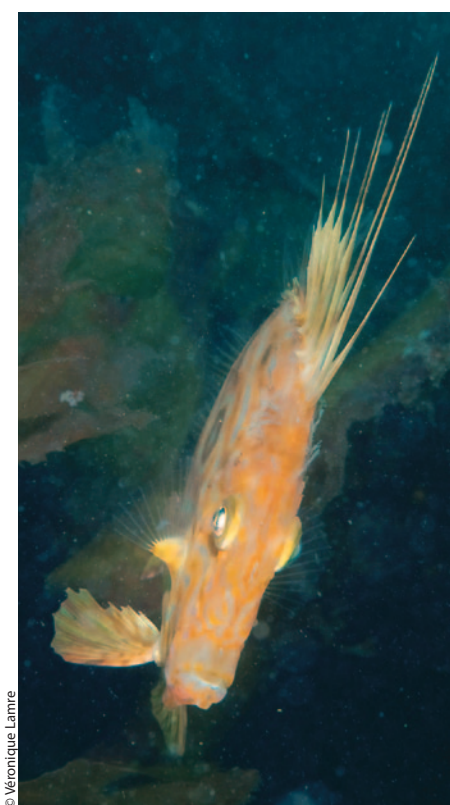
De face, un portrait surprenant!

cipitez-vous sur lui, et vous avez une forte probabilité de le voir s'enfuir devant vous. Poursuivez-le, et vous constaterez rapidement qu'en natation, il peut vous distancer aisément. Normal: malgré son allure de poisson austère aux lignes pas franchement hydrodynamiques, il risque de vous laisser sur place avec vos longues palmes et votre gros appareil photo! Il vous restera votre frustration d'avoir vécu une rencontre aussi rare que brève... Le photographe pourra se retrouver avec pour tout cliché une photo de queue, ce qui n'est pas des plus satisfaisant, il s'en rendra rapidement compte à l'écoute des commentaires de ses confrères et, pas toujours, amis... Peut-on éviter cette déconvenue? Oui, en sachant anticiper les réactions de l'animal rencontré. La position des nageoires du saint-pierre peut vous renseigner sur ses intentions. Il était immobile, tranquille quand vous vous êtes approché de lui. Observez alors surtout sa grande nageoire dorsale: s'il modifie soudainement sa position, soyez vigilant! Il risque en effet de filer à l'anglaise d'un instant à l'autre. Il vaut mieux alors, dans ce cas, cesser votre approche, arrêter de l'agacer avec votre lampe