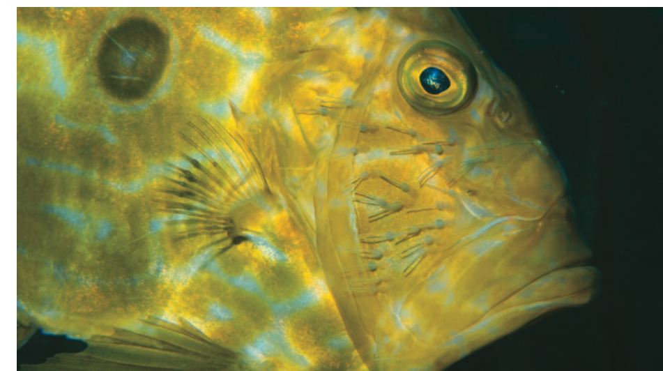
Le saint-pierre peut souvent être parasité par des crustacés copépodes.

ou vos flashes, et il serait même judicieux de prendre un peu de la large pour lui signifier qu'il peut avoir la paix un moment. À vous d'estimer ensuite le moment opportun, et la distance satisfaisante à conserver, pour tenter à nouveau une rencontre à plus faible distance. "Fuis-moi je te suis, suis-moi je te fuis" est un adage que les photographes ont déjà pu vérifier avec certaines espèces de poissons curieux. Si vous voulez tirer un beau portrait de ce singulier poisson, de trois-quarts face ou de profil, à distance intéressante, il suffira parfois de le laisser venir vers vous. Intrigué et curieux, c'est lui qui pourra effectuer l'approche pour observer cet étrange individu quelque peu pataud, avec son appendice à gros œil et ses diverticules lumineux! ■