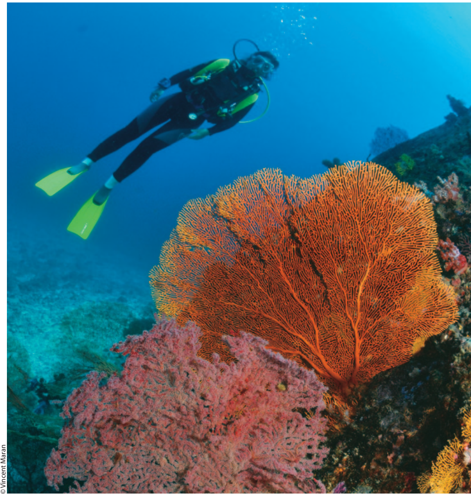
Le monde marin est riche d'une grande diversité d'organismes se développant sur le mode du réseau, parmi eux: gorgones et coraux.

DORIS m'a dit qu'il fallait absolument lui réserver la soirée du 4 décembre... Tous ses amis seront invités pour son anniversaire! Cinq ans, ça se fête: un lustre est passé depuis sa naissance sur la toile. Par Vincent Maran, avec la participation de Frédéric André.