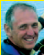
Par Jacques Dumas.

Le plongeur défiant les requins... Une façon de se faire valoir en société grâce à la mauvaise réputation que le film "Les Dents de la mer" a collée à la peau (certes rugueuse) de ces poissons cartilagineux dont les dents ornent les colliers "des grands chasseurs" de ces monstres terrifiants... C'est vrai qu'au nom du "danger" (quasiment inexistant pour la grande majorité des espèces), il est facile de décider le génocide d'un groupe d'animaux, d'autant que les victimes ne peuvent s'expliquer devant le grand jury des hommes si prompts à tuer. Le plus grand prédateur n'est pas celui que l'on veut faire croire, c'est bien l'homme qui sous divers (bons) prétextes satisfait sa soif de domination et de sang, en massacrant les requins. Ah oui ! J'allais aussi oublier les bonnes vieilles traditions, la préparation d'un potage insipide, cette fois-ci le meurtre pour juste des ailerons... Heureusement certaines associations soucieuses des océans et de générations futures, se sont regroupées autour de Shark Alliance pour dénoncer certaines pratiques de pêche, qui, non contentes de faire disparaître près du tiers des espèces de requins, viennent par voie de conséquence déstabiliser complètement les écosystèmes marins.