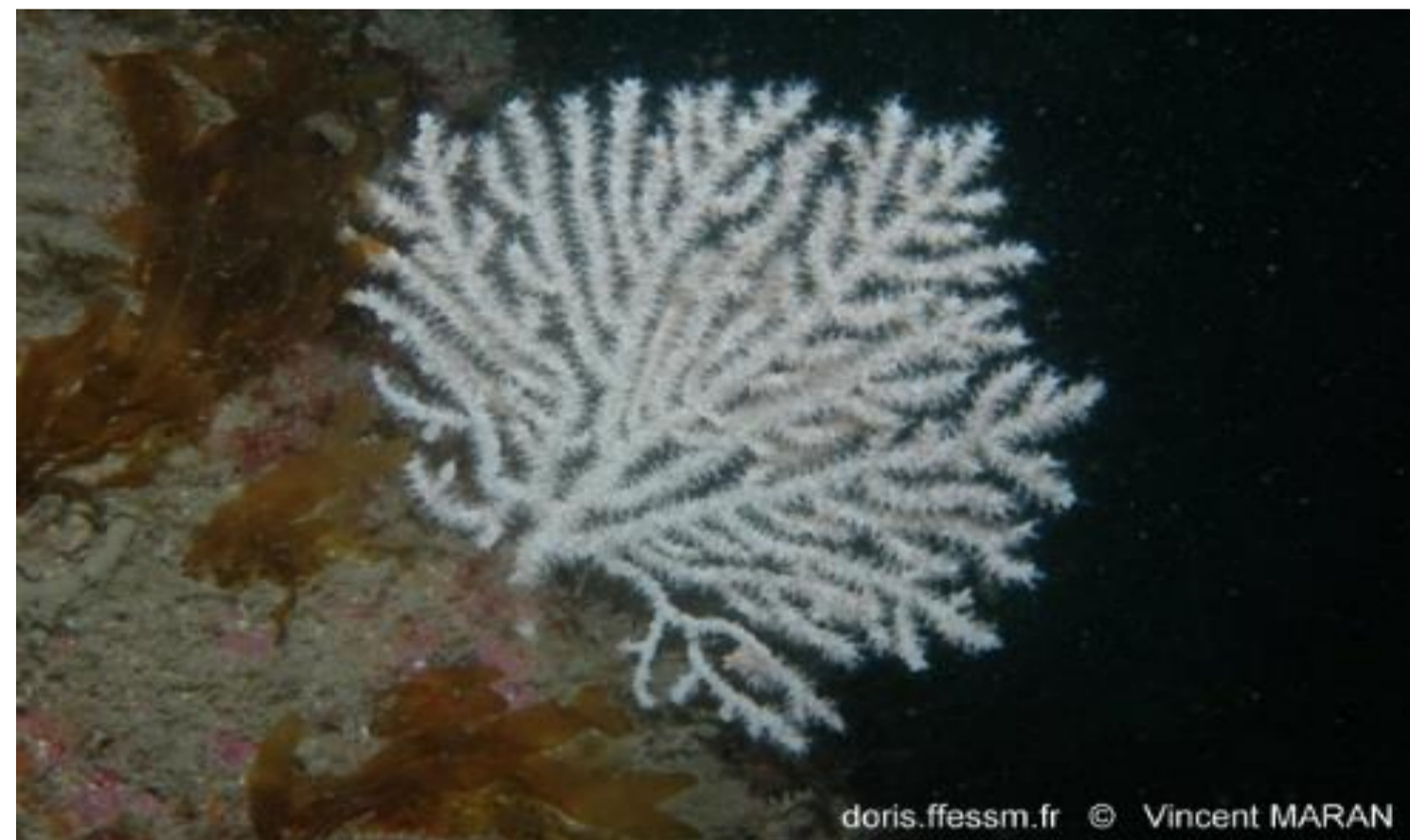
Gorgone verruqueuse - 14,45%