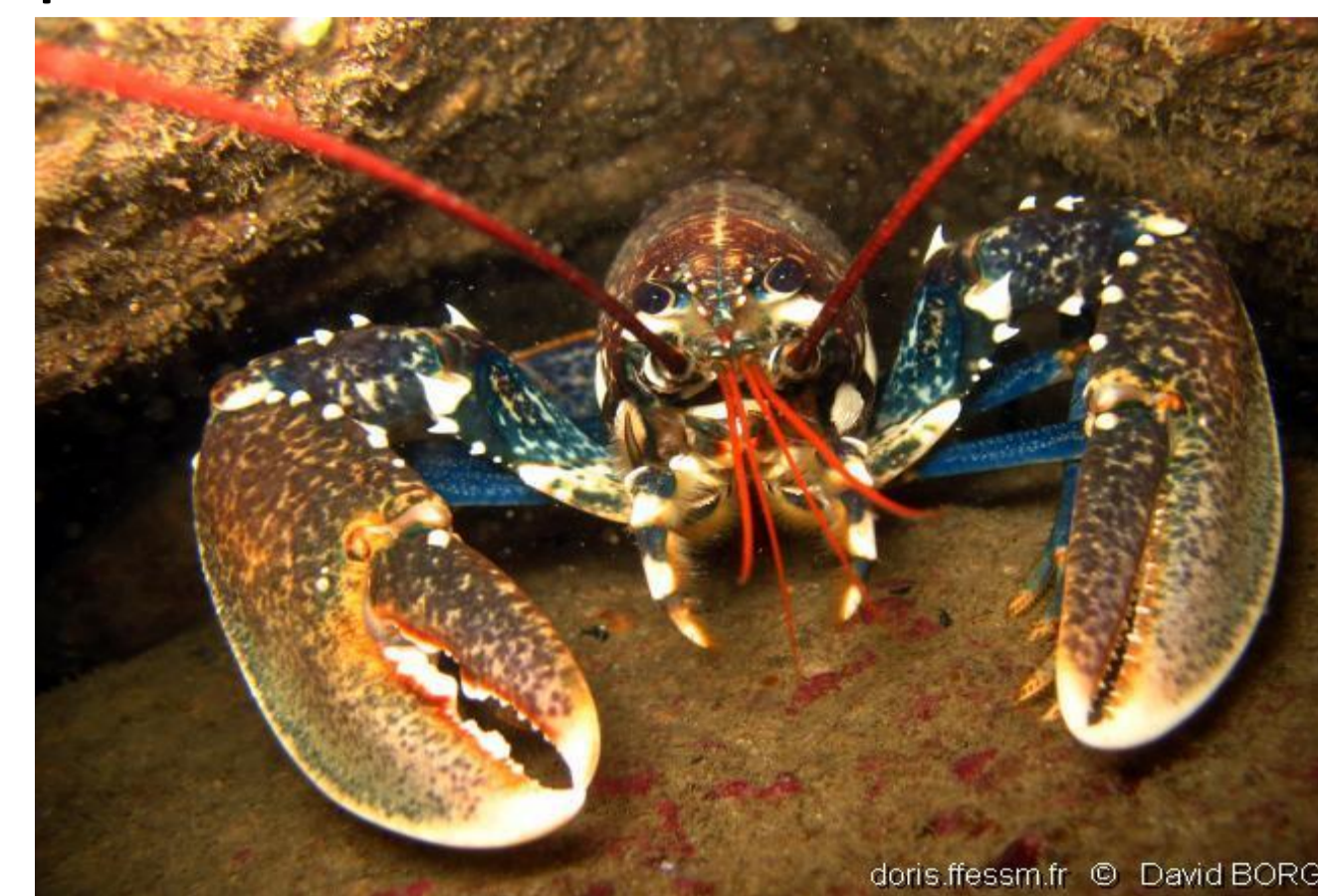
Homard européen - 29,66%