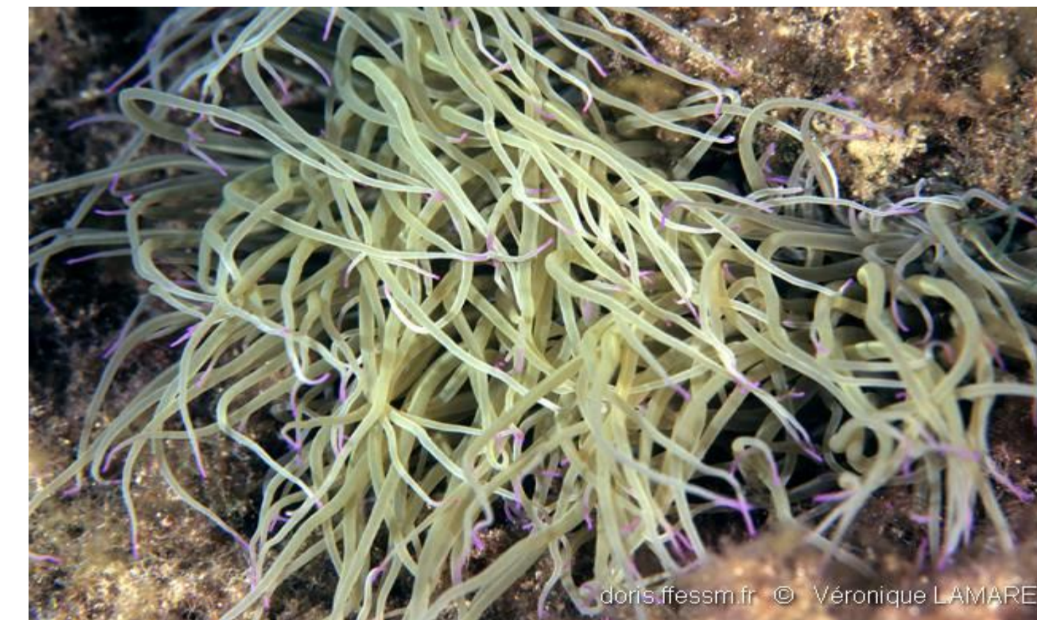
Anémone de mer verte - 10,60%