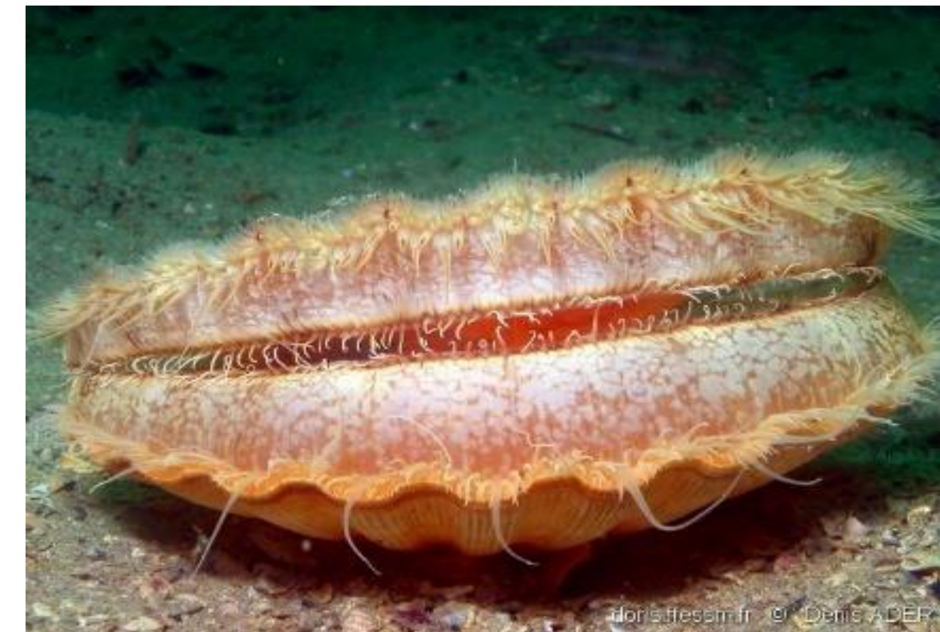
Coquille Saint-Jacques - 9,96%