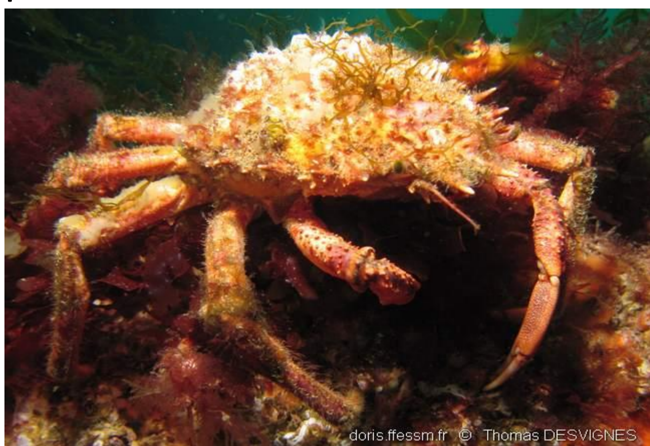
Araignée de mer Atlantique - 31,26%