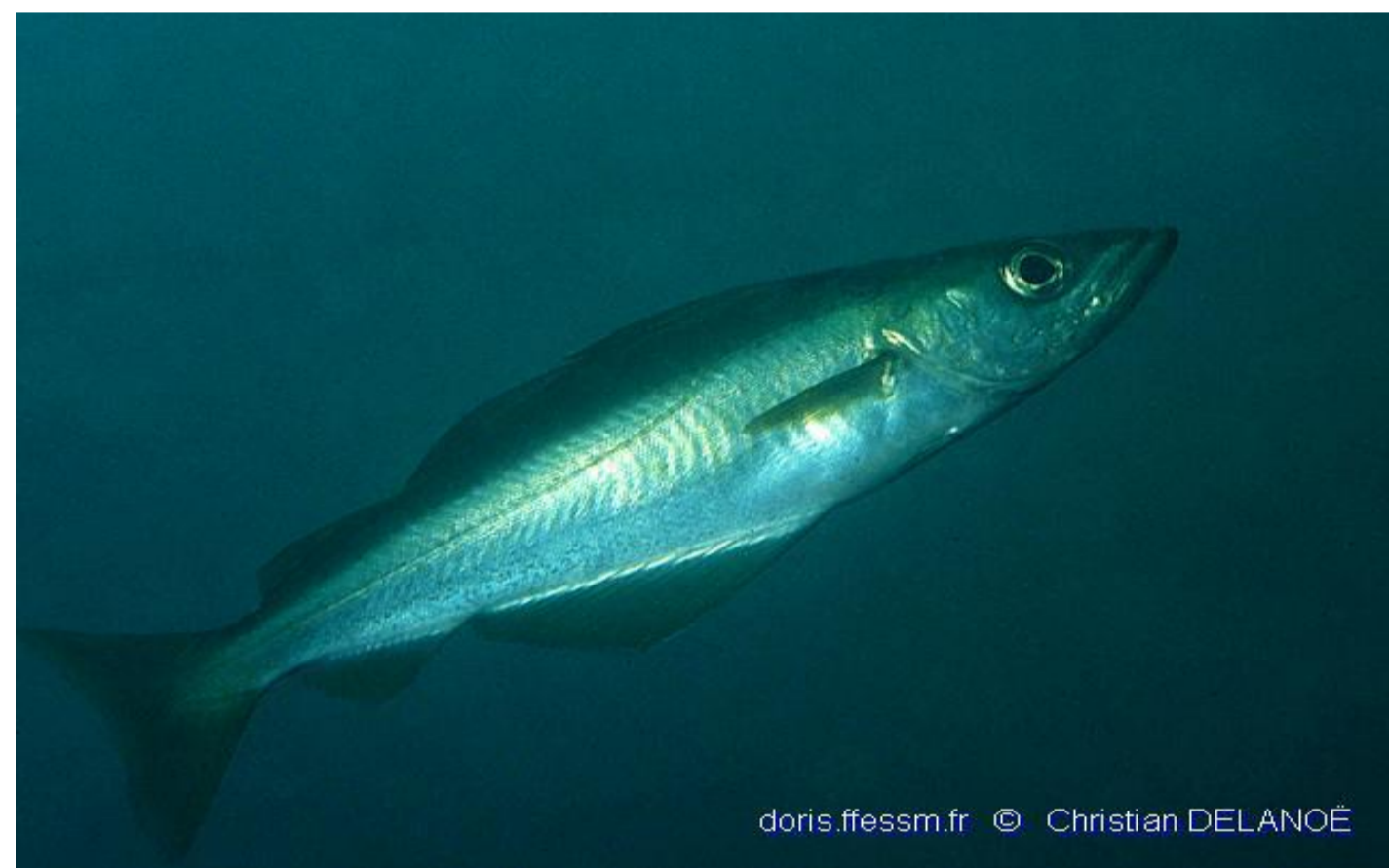
Lieu jaune - 15,42%