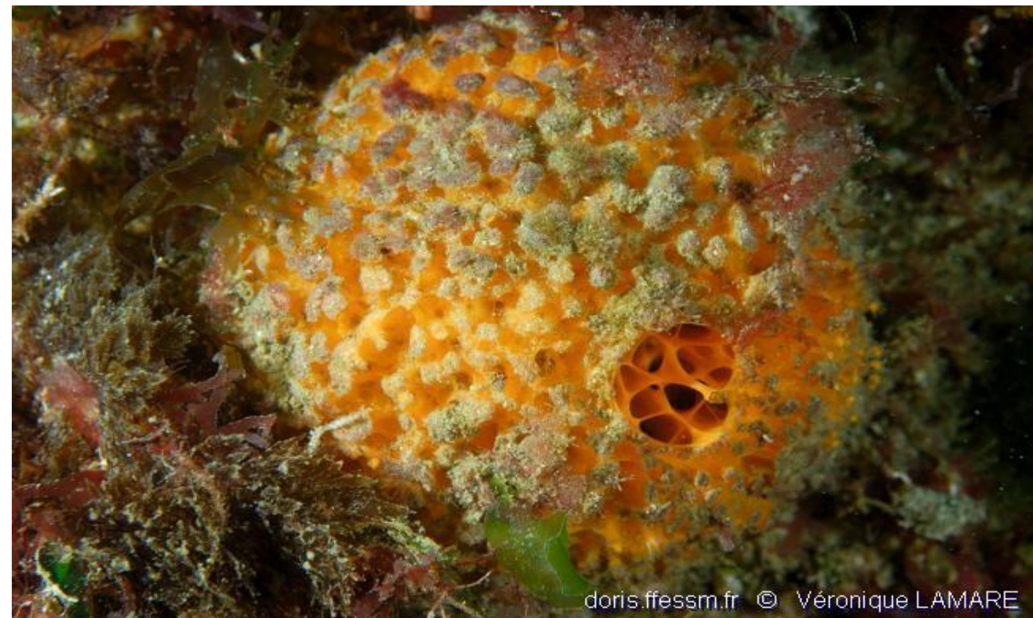
Orange de mer - 9,96%