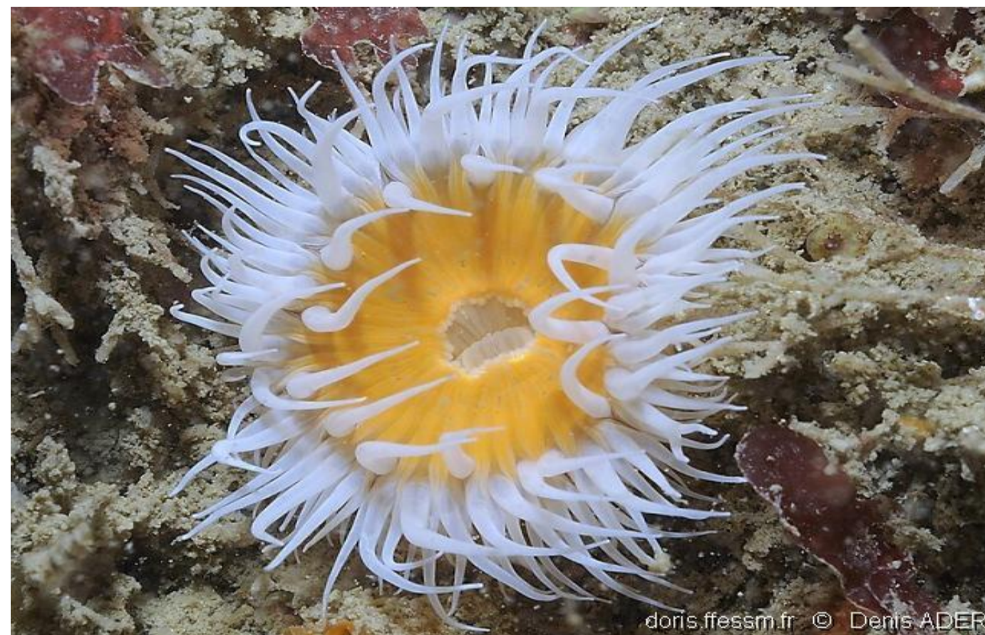
Anémone-marguerite - 10,71%