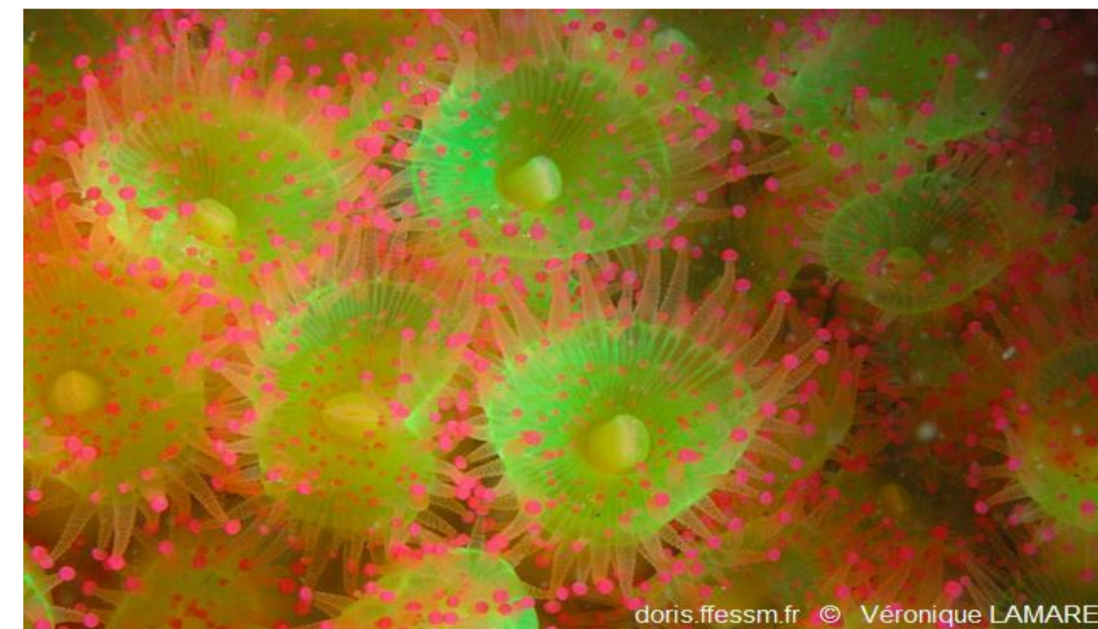
Anémone-bijou - 14,78%