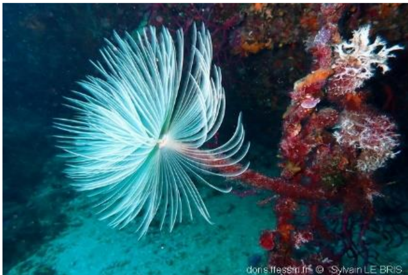
Spirographe - 12,21%