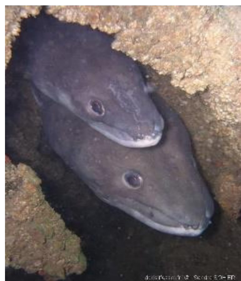
Congre - 31,58%