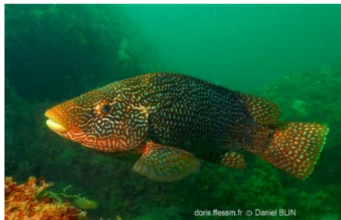
Grande vieille - 27,19%