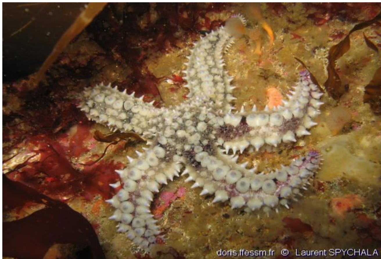
Etoile de mer glacière - 9,96%