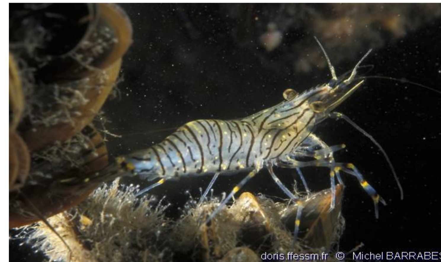
Grande crevette rose - 11,99%