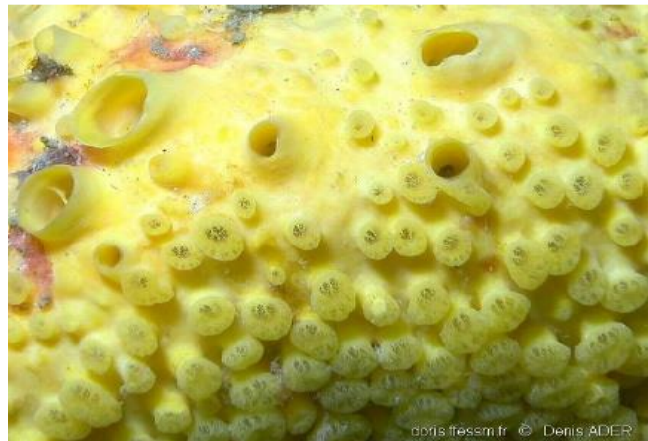
Clione jaune - 11,24%