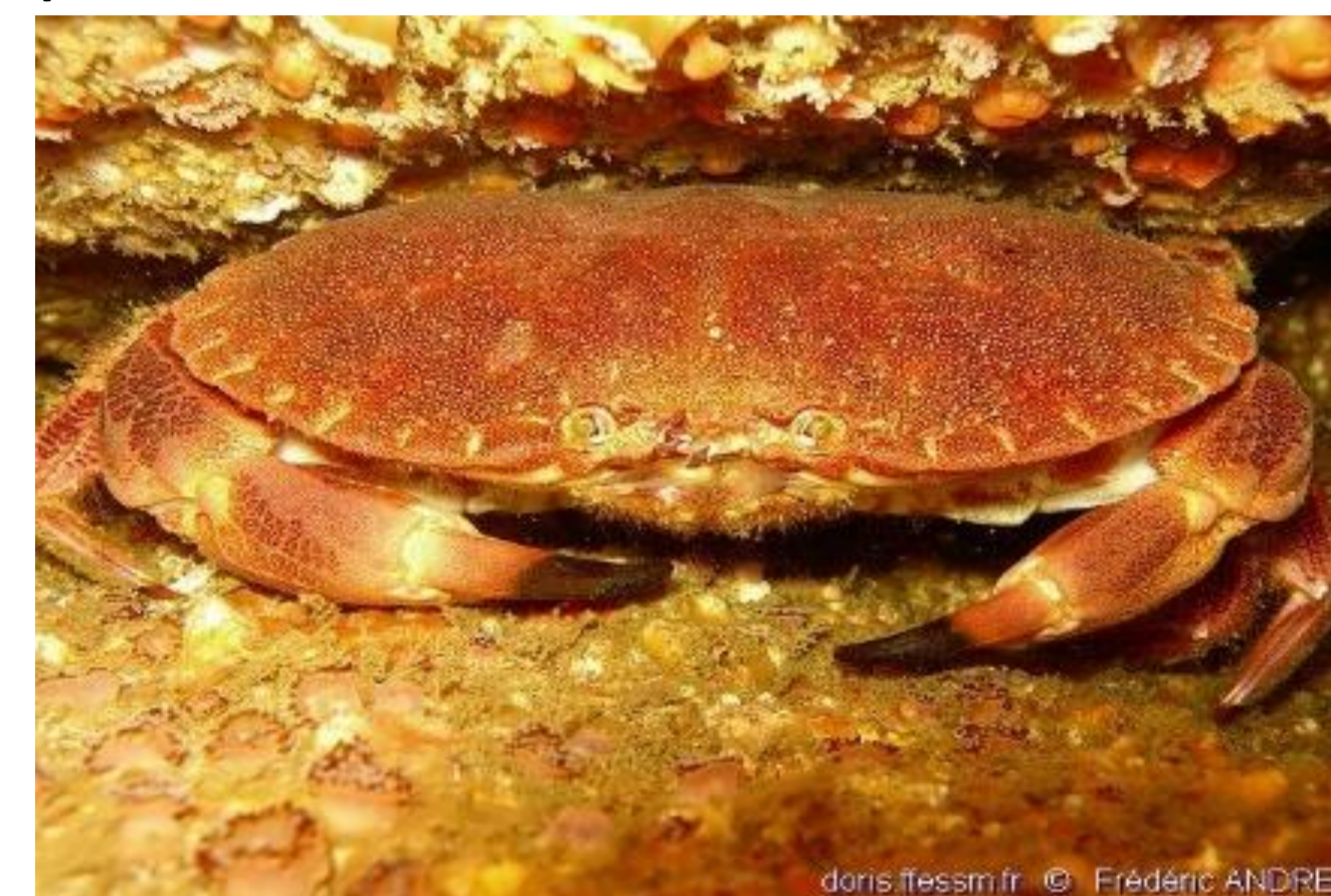
Tourteau - 18,63%