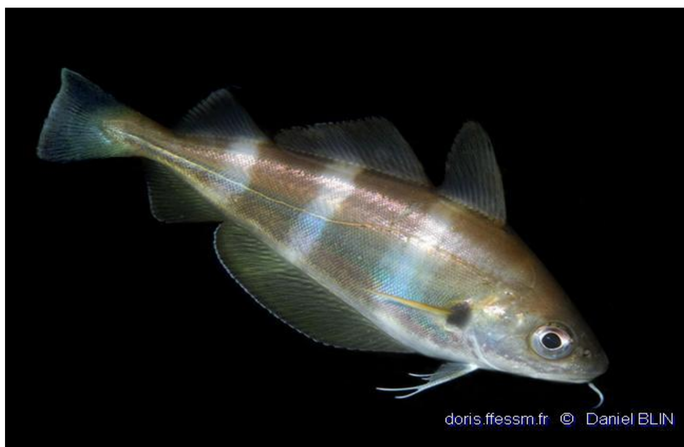
Tacaud commun - 25,27%