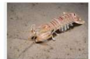
Squilla ocellée Squilla mantis