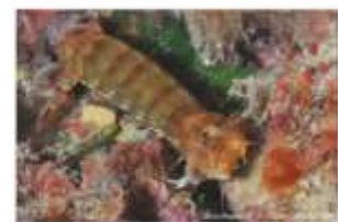
Squilla de Cérisy Pseudosquillaopsis cerisyi

3 espèces trouvées | Liste | Vignettes | Grandes images | Tri par nom scientifique A > Z