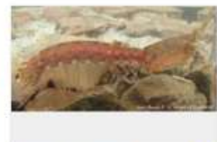
Squilla de Desmarest Rissoides desmaresti