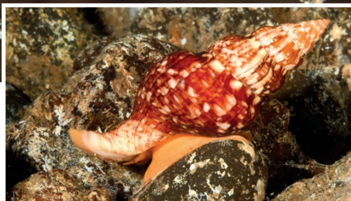
Un beau spécimen de buccin veiné ( Euthria cornea ).