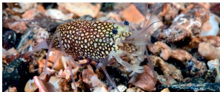
Une crevette drimo ( Gnathophyllium elegans ) à teinte claire.

verruqueuse de Méditerranée ( Bunodeopsis strumosa ). Elle présente la particularité d'être très mobile, choisissant l'été de s'installer notamment sur des herbes marines (posidonies, cymodocées et zostères) et l'hiver de s'enfouir dans les sédiments marins. En fin de plongée, une petite merveille dont le nom commun, pétalifère, est la francisation du nom scientifique qui présente la particularité d'être une répétition qui sonne joliment à notre oreille : Petalifera petalifera ! Étymologiquement, ce nom signifie : « porteur d'une lame ». La lame, c'est la forme extrêmement effilée du corps de ce petit lièvre de mer. Cette silhouette, ainsi que la couleur de ce petit mollusque sont extrêmement mimétiques d'une feuille de posidonie. Pour tous les membres de notre palanquée, cette observation est une première ! Au cours de notre séjour à Ustica nous aurons eu le plaisir de vivre des plongées dans des eaux cristallines et très souvent dans une superbe architecture sous-marine. Surtout, et c'était notre objectif, chacun de nous a eu le grand plaisir de faire des observations naturalistes très originales sans avoir parcouru auparavant des milliers de kilomètres. Un regret néanmoins en terminant cet article : la rédaction de Subaqua a énergiquement refusé de m'accorder les 15 pages supplémentaires qui m'étaient nécessaires pour vous présenter l'ensemble des photos que j'avais prévues en plus pour illustrer toutes les espèces rencontrées ! ➔