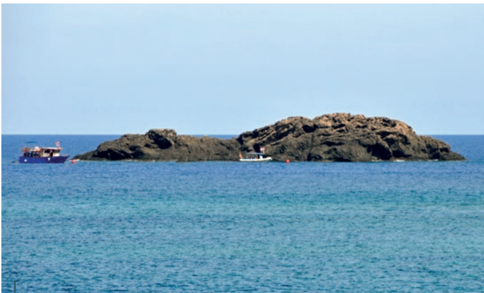
Le spot de plongée de Scoglio del Medico (ou en français Le Rocher du médecin) est réputé pour être le spot le plus connu et certainement le plus beau d'Ustica.