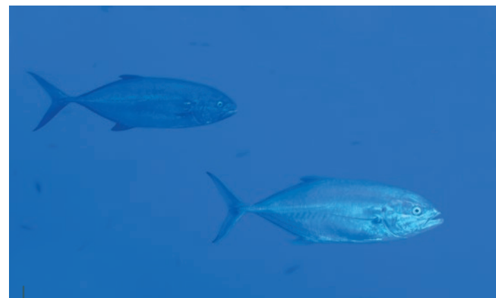
Deux carangues coubali en chasse.

Ben oui, au risque d'étonner certains esprits chagrins, c'est en plongeant dans les zones mises à l'abri de toute prédation humaine que le plaisir de la rencontre avec de nombreux poissons de grandes tailles est le plus important ! Il doit y avoir une certaine logique et on peut l'affirmer sans réserve : multiplier les aires marines réellement protégées ne peut avoir que des conséquences positives sur le monde vivant et sur la satisfaction des plongeurs. Créée en 1986, la Réserve naturelle marine de l'île de Ustica a été la première réserve marine italienne protégée. Divisée en 3 parties (intégrale, générale et partielle), cette réserve a permis la protection d'un écosystème unique dans lequel nous avons plaisir à faire des observations tout à fait originales. Jamais en Méditerranée je n'avais pu retrouver les sensations ressenties lorsque l'on a, à quelques mètres de soi, le spectacle d'une chasse de grands prédateurs au sein d'un banc de « petits poissons ». En mer Rouge, ou ailleurs dans le domaine indo-pacifique, il n'est à l'inverse pas rare de voir des carangues ou des bonites chasser dans les bancs du menu fretin. En plongeant à Punta falconiera, nous remarquons d'abord le comportement des castagnoles et des bogues, elles ont la vie moins tranquille que le long de nos côtes continentales ! Régulièrement,