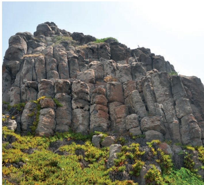
Les remarquables orgues basaltiques d'Ustica.

Pour arriver à Palerme, votre avion vous fait survoler la mer Tyrrhénienne dans sa plus grande longueur. Un ferry rapide vous fait naviguer ensuite en sens inverse, donc vers le nord-ouest, sur une distance de 36 miles nautiques. L'arrivée dans le minuscule port d'Ustica ne manque pas de charme, la ville s'étend en amphithéâtre autour de ses eaux d'une grande clarté. On remarque immédiatement le relief escarpé qui permet de rejoindre la partie haute de la ville, joli bourg qui s'organise, nous sommes bien en Italie, autour d'une imposante église. L'essentiel de la population, un peu plus de 1300 habitants, vit et travaille dans ce gros bourg. La base du volcan ancien qui constitue l'île d'Ustica est localisée sur un fond marin en plateau situé à environ 2000 m de profondeur. Plusieurs épisodes volcaniques ont eu lieu dans un passé ancien et on remarque bien la dissymétrie géologique et donc le relief qui en résulte. Globalement, la partie sud de l'île est basaltique, avec des reliefs marqués et d'énormes bulles de gaz ont modelé la lave pour faire apparaître un certain nombre de grandes cavités qui sont remarquablement intéressantes pour la plongée. Si la partie nord de l'île présente bien moins de relief c'est parce