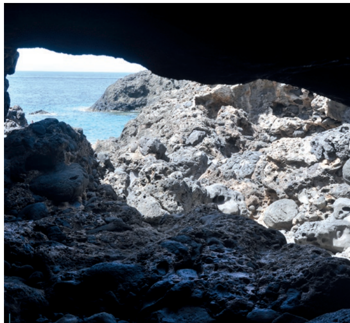
Un tunnel de lave : une cavité particulièrement intéressante pour les plongeurs lorsqu'elle se trouve sous le niveau de la mer.

qu'elle a subi un certain nombre d'épisodes explosifs ayant détruit quasiment la moitié du volcan d'origine. Celui qui sait observer les roches, et ce n'est pas trop difficile avec un minimum de curiosité, remarquera qu'il y a de ce côté de l'île bien davantage de cendres volcaniques consolidées. Évidemment, c'est donc son origine géologique comportant des roches noires de type basaltique qui a donné à Ustica son surnom de « perle noire » dans un environnement couleur d'azur lui offrant une météo clémente. On peut se loger à prix très raisonnables à petite distance du port et rejoindre chaque jour à pied le bateau du club de plongée. La cuisine est méditerranéenne comme il se doit et, aux spécialités siciliennes, s'ajoute une touche locale avec quelques particularités liées à son histoire et son insularité. Randonneurs et curieux d'histoire peuvent parcourir en bord de mer ou à l'intérieur des terres un certain nombre de sentiers qui leur permettent de découvrir un riche patrimoine humain et naturel. Et que dire de l'observation des étoiles une fois le soleil couché : sans la pollution lumineuse continentale, elle offre un charme infini !