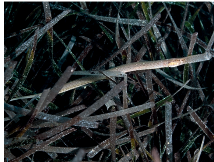
Le siphonostome de Méditerranée ( Syngnathus typhle rondeleti ).

Le rocher du docteur ou plutôt comme on dit ici « Scoglio del Medico » est un petit massif rocheux qui affleure en limite de zone intégrale. Ce site permet plusieurs plongées, sans doute parmi les plus belles d'Ustica. Certains canyons, entre les écueils, offrent des perspectives vertigineuses mais surtout, nous avons le plaisir d'observer, en une seule plongée, trois espèces de mérous différentes ! Il y a bien sûr le mérou brun, celui qui a fait un retour en force sur les côtes françaises depuis le moratoire qui le protège, mais nous avons aussi le plaisir de rencontrer des badèches ( Epinephelus costae ) ainsi que des mérous royaux ( Mycteroperca rubra ). Certains de ces mérous semblent effectuer des danses qui doivent faire partie d'un comportement de reproduction. Bon présage pour le futur des mérous à Ustica ! Autour de Scoglio del Medico on peut aussi apprécier la présence d'un magnifique banc de bécunes, nos barracudas de Méditerranée, qui forment parfois d'impressionnants cercles pour le plus grand bonheur des plongeurs qui peuvent les observer longuement à partir du moment où ils gardent une attitude paisible. C'est également à Scoglio del Medico que l'on peut observer les plus impressionnantes sérioles. Les plus grands individus doivent être proches de la taille maximale de l'espèce, soit deux mètres. Il y a toujours un moment, au moins un, qui amène les sérioles à s'approcher de vous, par curiosité. C'est à ce moment-là qu'il ne faut pas louper la photo !