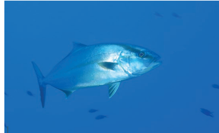
Une très grande sériole vient m'inspecter.

Quand on parle de carangues à un plongeur français, il ne pense jamais, ou exceptionnellement, à la Méditerranée. Et pourtant, il a dû croiser plus d'une fois des poissons de la famille des Carangidés puisque les chinchards en font partie ! Les sérioles font également partie de la famille des Carangidés. On le comprend davantage, vu la taille qui peut être assez imposante de ces beaux poissons. Leur forme est toutefois plus élancée que celle des carangues qui peuvent être rencontrées dans le domaine indo-pacifique. Sur nos côtes, les « vieux plongeurs » avec qui je parlais à l'époque où je préparais mon niveau 1 me parlaient de très grosses liches ( Lichia amia ) qui venaient les voir durant leurs paliers. C'est du passé : lors de la rédaction, récente, de la fiche de cette espèce pour DORIS les recherches de photos sur les côtes françaises ont toutes été infructueuses... Ce poisson n'a pas disparu de nos côtes, mais il s'est fait bien plus rare, hélas. Une mise en place de mesures de protection ne pourrait que lui être favorable. Cinq ou six autres espèces de Carangidés d'assez grande taille, comme la carangue coubali, sont présentes en Méditerranée, mais les probabilités de les voir sur nos côtes sont extrêmement ténues.