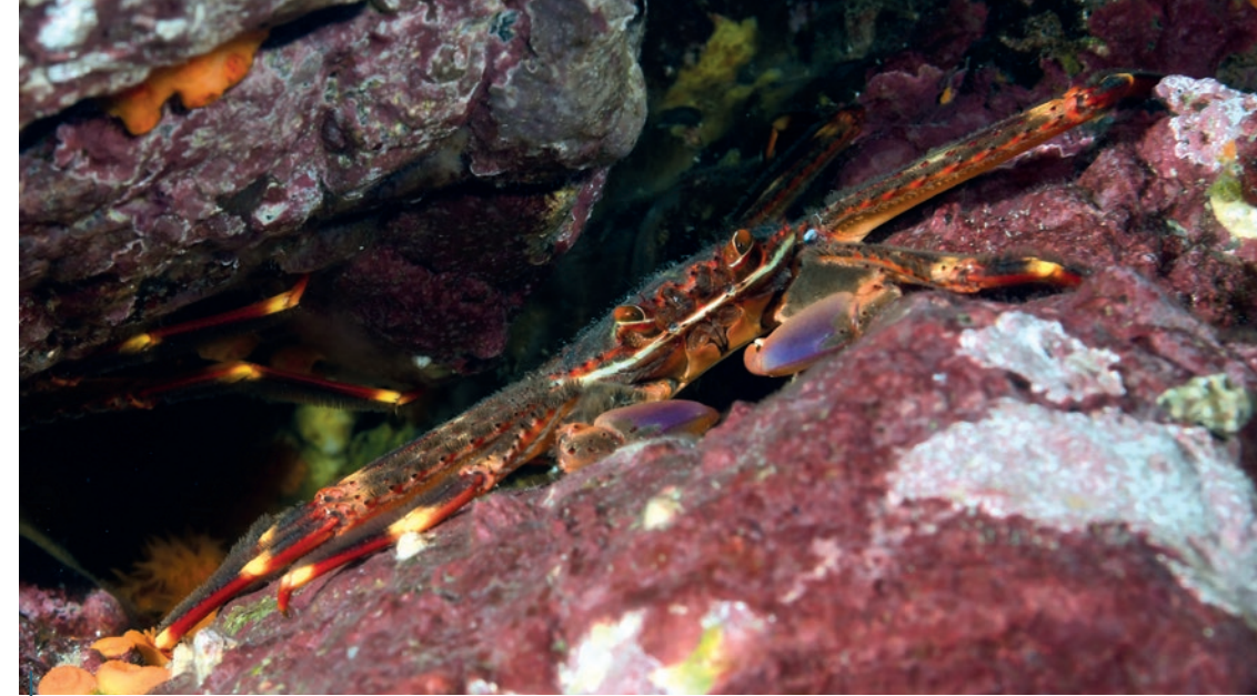
Le crabe plat des oursins ( Percnon gibbesi ), récemment arrivé en Méditerranée par Gibraltar.