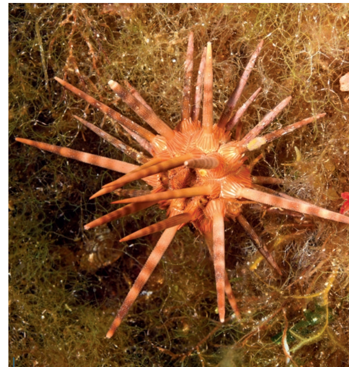
Par petit fond, un oursin-lance rouge ( Stylocidaris affinis ).