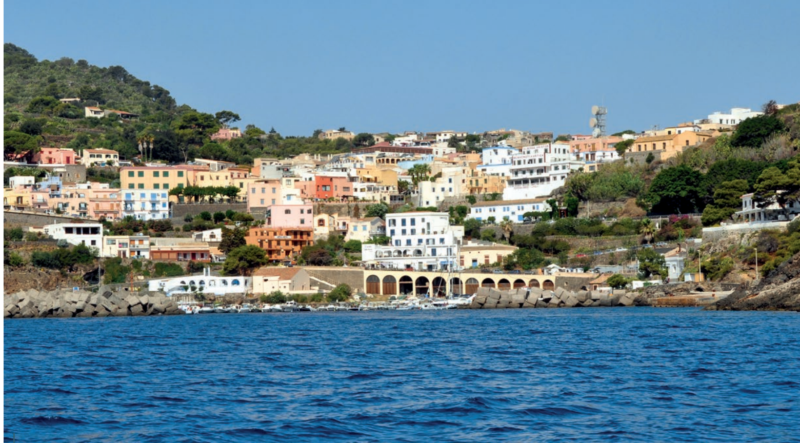
Ustica est l'un des endroits les plus enchanteurs de la Sicile. Son territoire de seulement 9 km 2 en fait l'un des îles les plus petites de la région de Palerme. Elle a toujours été une destination très prisée des touristes, grâce à ses formidables plages, en plus d'être l'un des principaux lieux de pratique siciliens plongée sous-marine, à tel point que l'on y trouve un grand nombre de clubs.